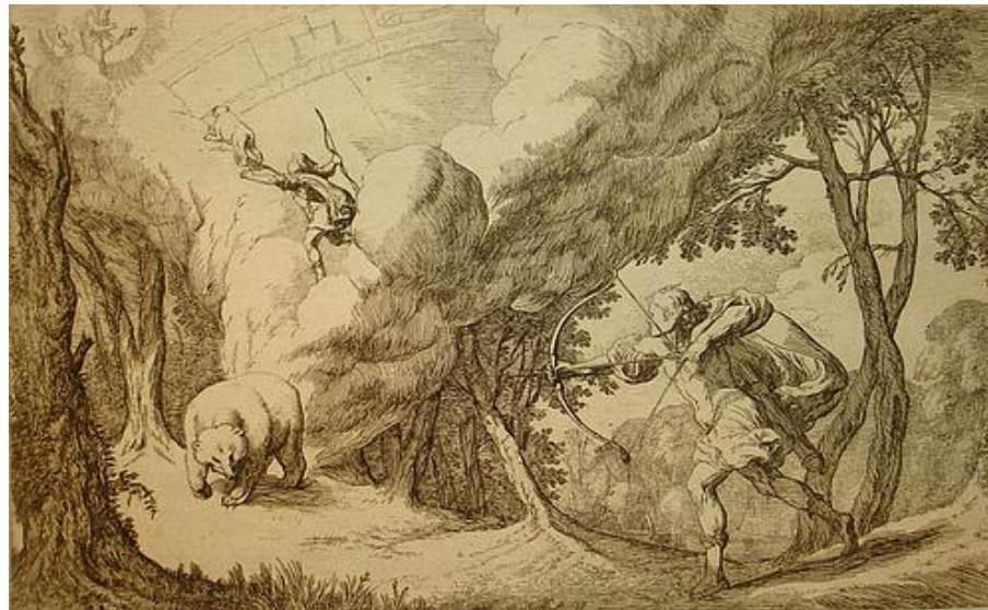
Grabat de Johann Wilhelm Baur (s.XVII). Mostra el moment en el qual Arcas caça Cal·listo i ambdós són convertits en constel·lació.

Un dia, mentre Arcas està caçant, veu una óssa molt gran i maca i vol capturar-la. Per evitar que Cal·listo sigui morta pel seu propi fill, Júpiter decideix convertir-los en constel·lacions: Cal·listo en l'Óssa Major i Arcas en el seu guardià, l'Óssa Menor.